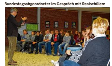
Der CDU-Bundestagsabgeordnete Mathias Middelberg suchte das Gespräch mit Zehntklässlern der Wallenhorster Realschule.

hal WALLENHORST . Besuch aus der Hauptstadt bekam in dieser Woche der zehnte Jahrgang der Wallenhorster Realschule: Der CDU-Bundestagsabgeordnete Dr. Mathias Middelberg sprach mit den Jugendlichen über seine politische Arbeit und aktuelle Themen. Neben Fragen zu Flüchtlingssituation, AfD und Koalitionspartnern standen auch die amerikanische Präsidentschaftswahl sowie die Freihandelsabkommen Ceta und TTIP auf der Agenda.