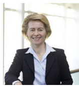
Bundesministerin Dr. Ursula v.d. Leyen Fr, 30.8.2013 13:00 Uhr

Belmer Mahlzeit Schützenverein Belm, Zum Sportplatz 3, Belm