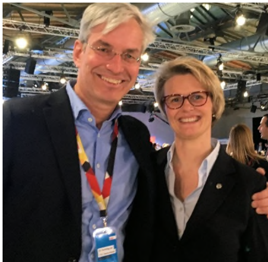
Mit meiner Wahlkreisnachbarin Anja Karliczek beim CDU-Bundesparteitag in Berlin

Am 14. März wird die Bundeskanzlerin gewählt. Dann steht – endlich, 25 Wochen nach der Bundestagswahl, – die neue Bundesregierung. Peter Altmaier soll neuer Wirtschaftsminister werden, Helge Braun Kanzleramtsminister , meine Wahlkreisnachbarin Anja Karliczek Ministerin für Bildung und Forschung , Julia Klöckner Ministerin für Landwirtschaft und Ernährung und Jens Spahn neuer Gesundheitsminister . Ursula von der Leyen wird Verteidigungsministerin und Monika Grütters Staatsministerin für Kultur und Medien . Die Vorsitzende der Frauen Union, Annette Widmann-Mauz , soll Staatsministerin für Integration im Kanzleramt werden, mein Hannoveraner Kollege und Freund Hendrik Hoppenstedt Staatsminister für die Zusammenarbeit von Bund und Ländern .